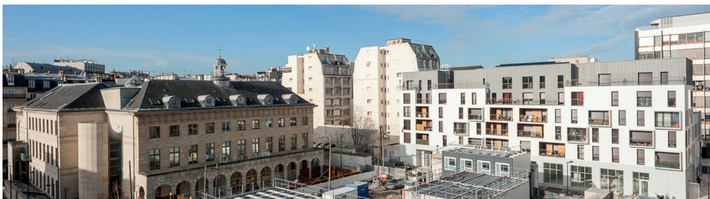
Vue d'ensemble