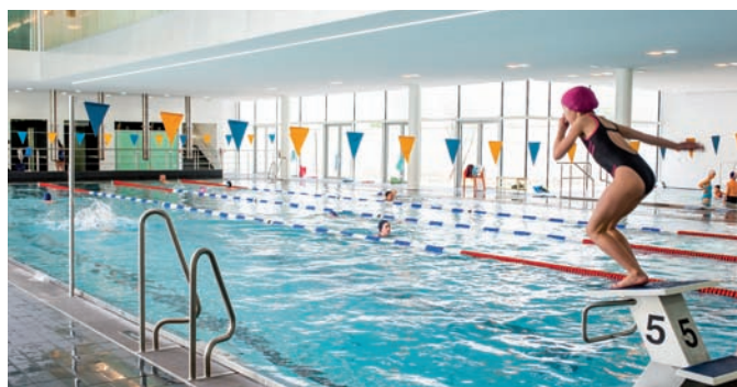
Centre sportif