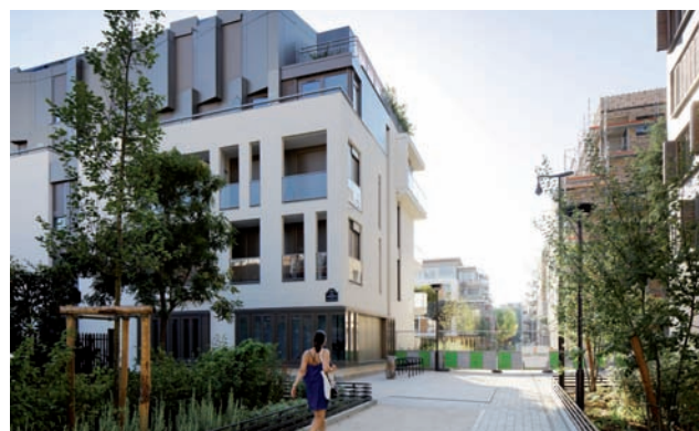
Allée piétonne et lot H