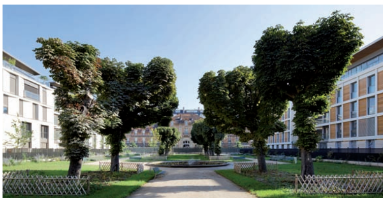
Square public